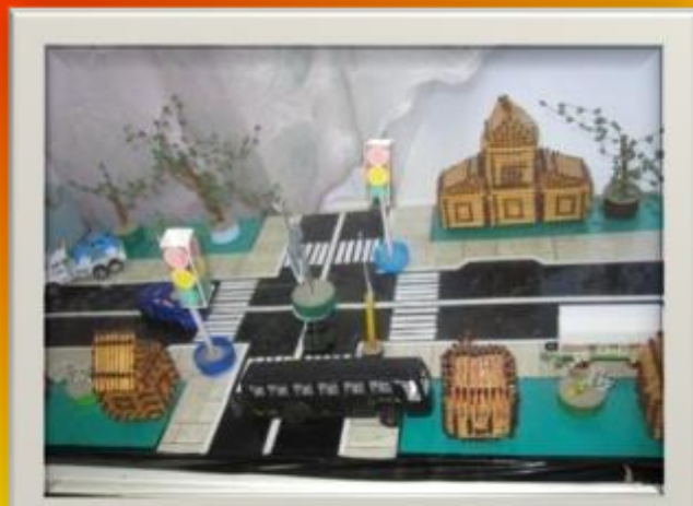
Макет перекрестка, созданный руками родителей